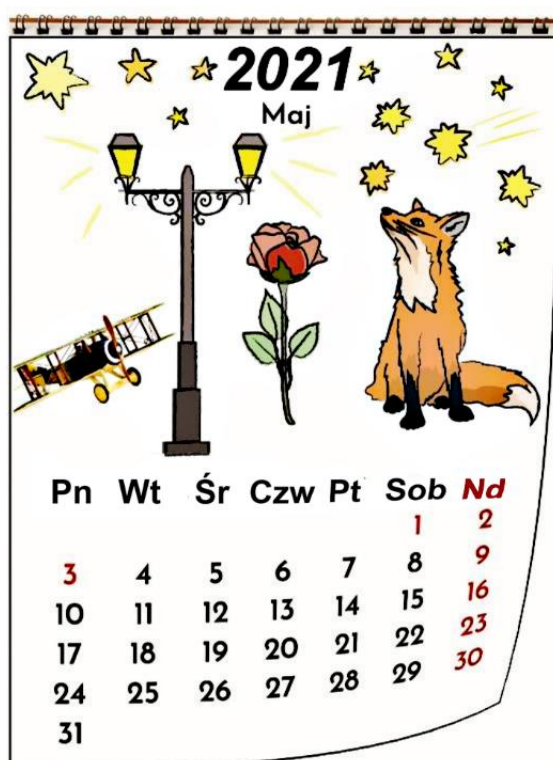
Karta nr 1